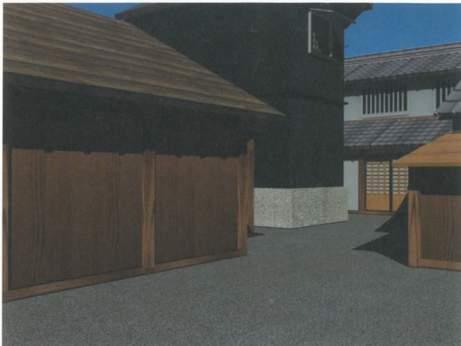
口絵1 米山勇「コンピュータ・グラフィックによる四谷塩町街並み再現の試み」より