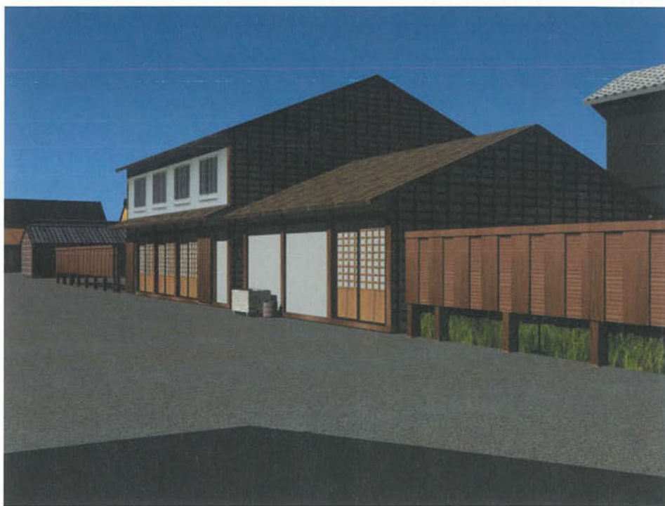
口絵2 米山勇「コンピュータ・グラフィックによる四谷塩町街並み再現の試み」より