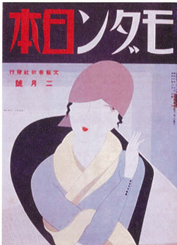
口絵6 『モダン日本』昭和6年2月号表紙 〈90210756〉