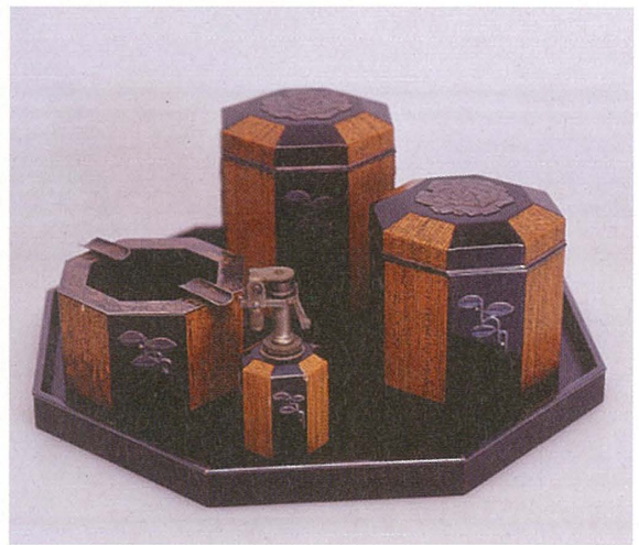
口絵8 「卓上喫煙具セット」 〈89000458〉