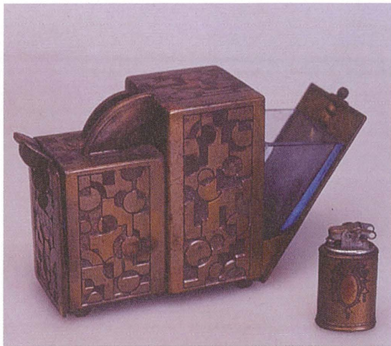
口絵7 「金属製喫煙具セット」 〈88010750〉