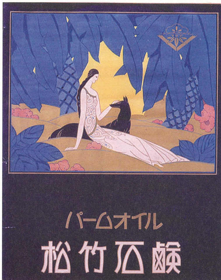
口絵5 パームオイル松竹石鹸ポスター 〈89207601〉