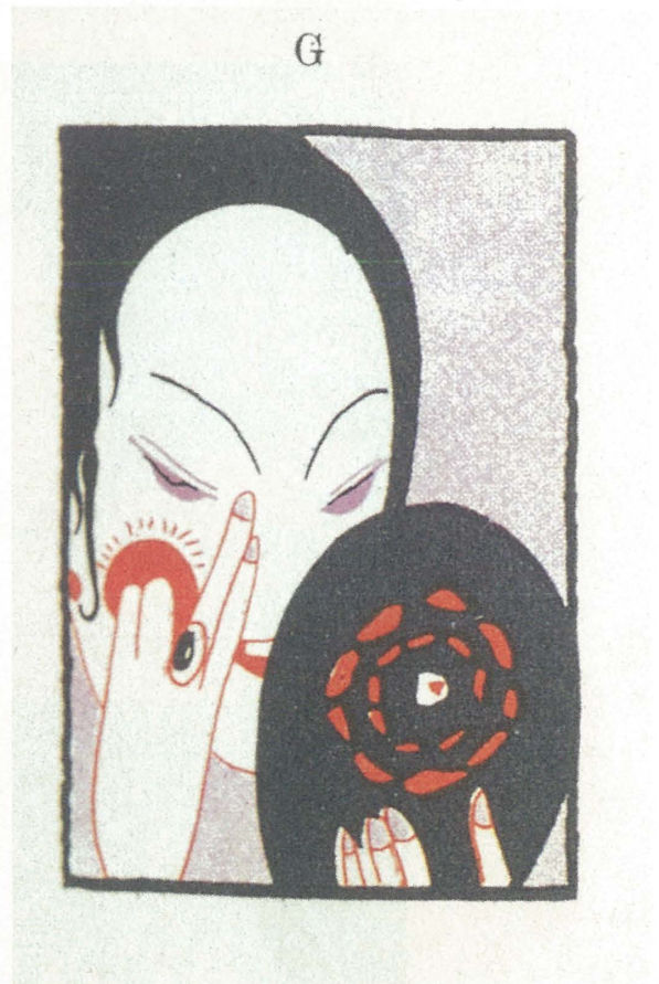
口絵3 秋吉秀雄 マッチのラベル『現代商業美術全集』18巻—チラシ・レットル図案集—1928年36頁所収〈88690243〉

※所蔵先を書いていないものは江戸東京博物館蔵品です。キャプションの最後にある8桁番号が、当館の資料番号となります。