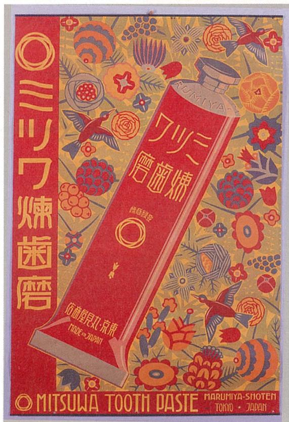
口絵4 ミツワ練歯磨ポスター 〈93201360〉