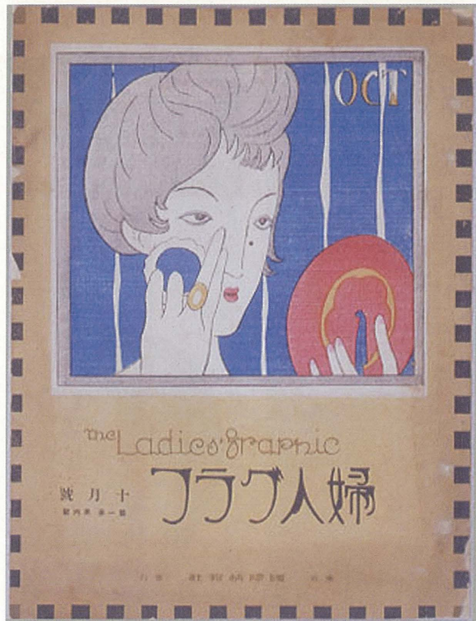
口絵1 竹久夢二「化粧の秋」(『婦人グラフ』1924年10月号、表紙)〈96201229〉