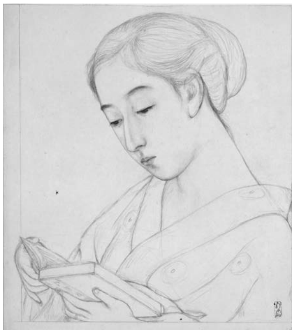
【図3】喜多川歌麿 「木挽町新やしき 小伊勢屋おちゑ」 千葉市美術館所蔵